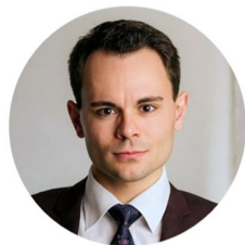
Clitandre, Verehrer der Angelique: STEFAN OFNER